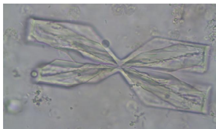
Urine, struvietkristal 400x vergroot.

Sinds kort hebben we de beschikking over een veel beter exemplaar waardoor we vooral de ingewikkelde onderzoeken beter kunnen beoordelen. Een beeld zegt vaak meer dan duizend woorden, vandaar dat de nieuwe microscoop voorzien is van een digitale camera. Dit geeft ons de mogelijkheid om snel te kunnen overleggen met collega's en specialisten. Ook zorgt dit er voor dat we de gegevens makkelijker kunnen bewaren zodat we later, als dat nodig is, de beelden nog eens terug kunnen bekijken. Hieronder ziet u twee voorbeelden uit de praktijk.